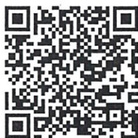
รายละเอียดงานอบรม