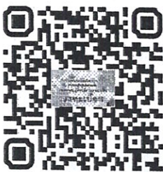
QR Code ลงทะเบียน

จึงเรียนมาเพื่อโปรดทราบและประชาสัมพันธ์ให้ผู้สนใจเข้าร่วมอบรมด้วย จะเป็นพระคุณ