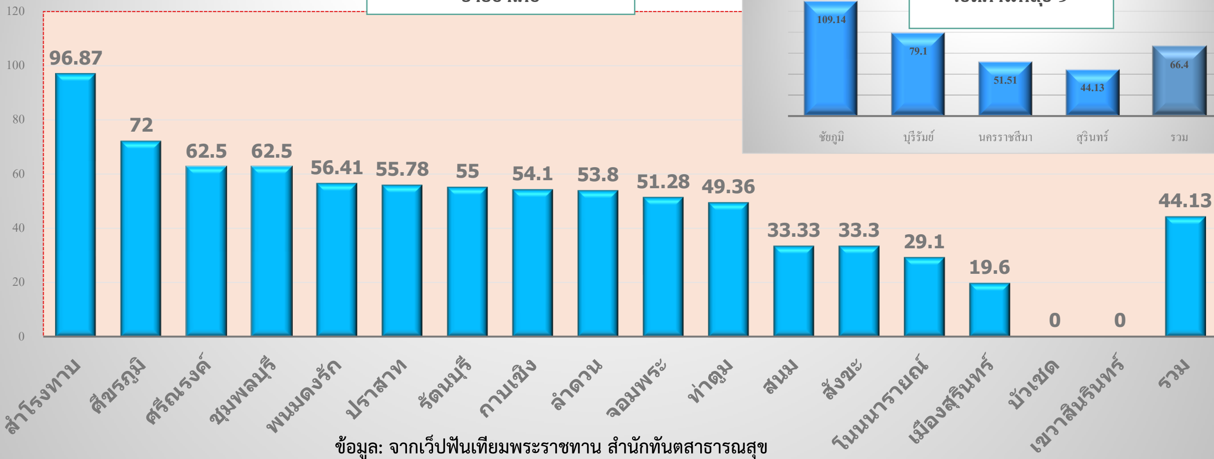
รายชื่ออำเภอ

ข้อมูล: จากเว็บฟันเทียมพระราชทาน สำนักทันตสาธารณสุข