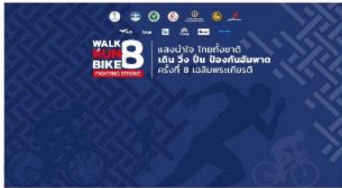
ภาพการสื่อสารหลัก - เว็บไซต์