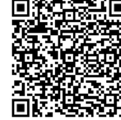
อำเภอสังขะ