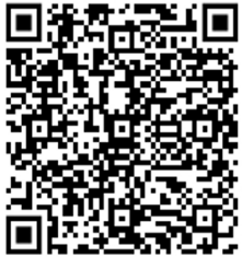
อำเภอจอมพระ