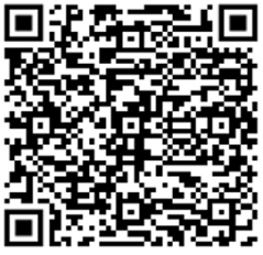
อำเภอเมืองสุรินทร์