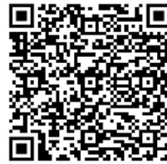
อำเภอรัตนบุรี