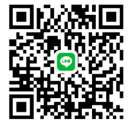
QR Code ไลน์กลุ่ม