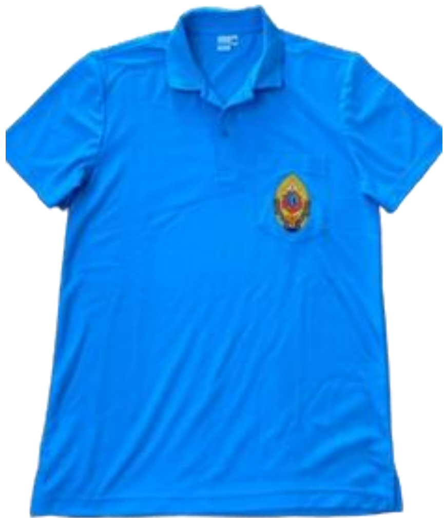
ตัวอย่างเสื้อโปโลสีฟ้า