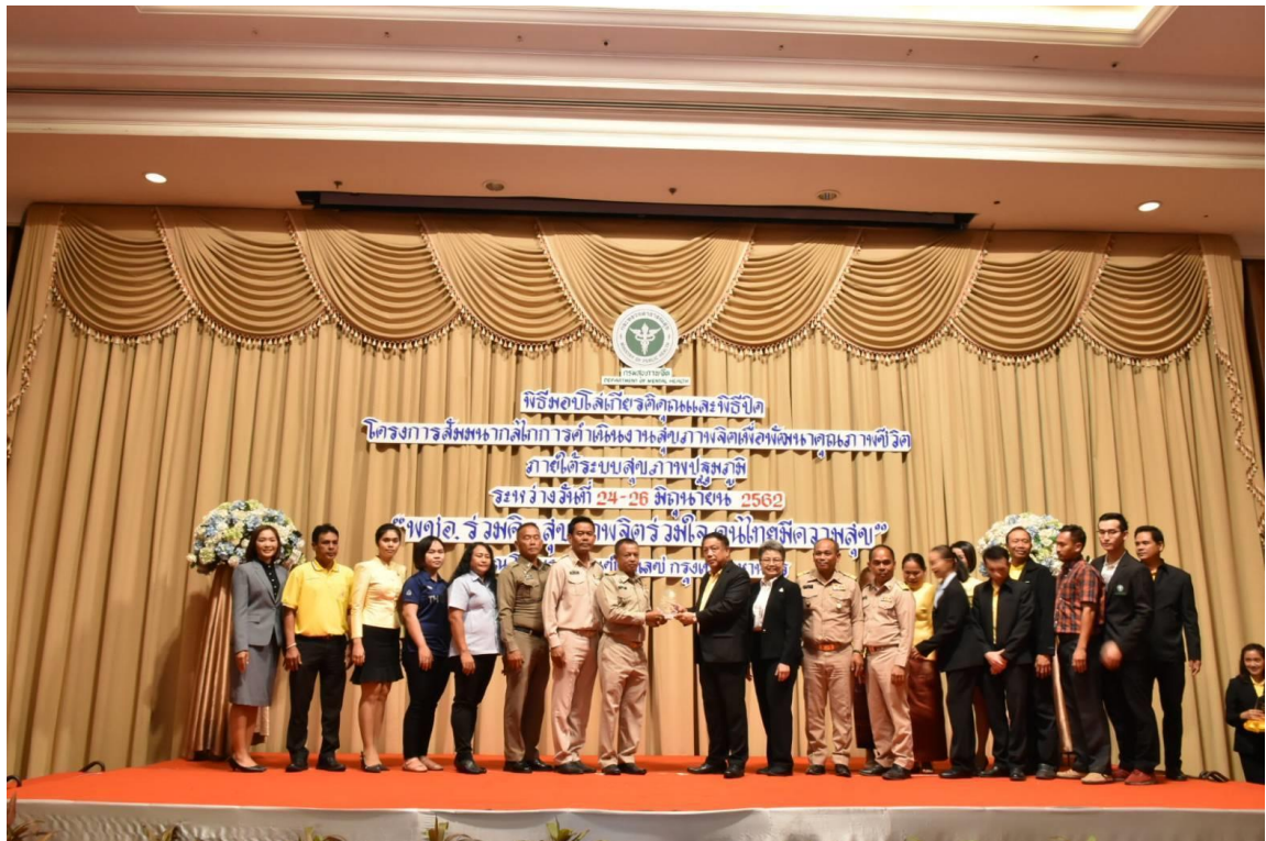
ทีมงานขึ้นรับมอบโล่รางวัล

ประธาน คณะกรรมการพัฒนาคุณภาพชีวิตระดับอำเภอเมืองสุรินทร์