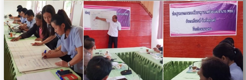
พชอ.ศรีณรงค์

11 มีนาคม 2562 คณะทำงานสมาคมโภชนาการในพระบรมราชูปถัมภ์ สมเด็จพระเทพรัตนราชสุดาฯ ได้ตรวจเยี่ยมพื้นที่จอมพระ ซึ่งเป็น bestmodel และ พบ คกก.พชอ.จอมพระ