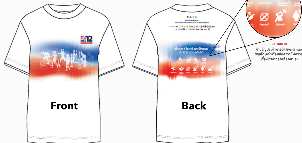
ภาพถ่าย คำขวัญประจำการจัดกิจกรรมและ สัญลักษณ์พร้อมข้อความให้ความรู้ เรื่องโรคหลอดเลือดสมอง

เสื้อแข่งขัน (ขณะนี้อยู่ในระหว่างการพิจารณาออกแบบเสื้อเพิ่มเติม)