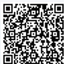
ลิงค์กรอกข้อมูล

กรอกข้อมูลสนามจัดกิจกรรมฯ ให้ แล้วเสร็จ ภายในวันที่ 30 เม.ย. 2569 เพื่อไทยรันจัดทำระบบรับ สมัครให้พร้อมใช้งาน